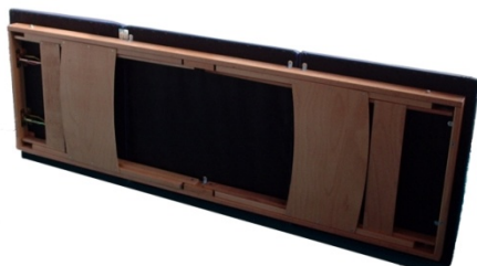
Chiuso con gambe e diagonali piegate

FOTO: Esempi vari di combinazioni lettini Keplero